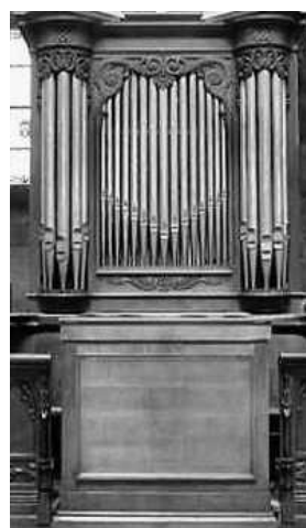
n°8 du catalogue "Orgues de tous modèles"